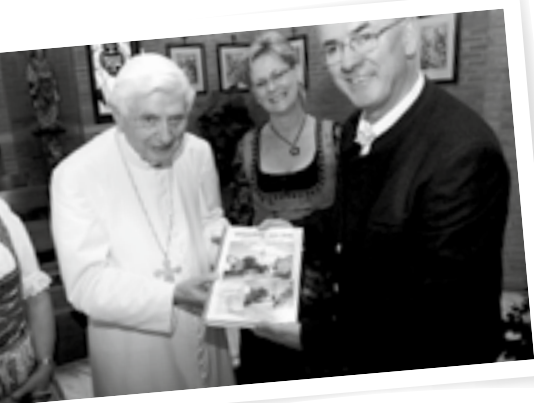
Auch der emeritierte Papst Benedikt XVI. hat das neue Würdinger Heimatbuch bereits in seiner Bibliothek im Vatikan.

Anlässlich der 1200-Jahr-Feier von Würding ist jetzt ein Heimatbuch unter dem Titel „Würding – Ein Dorf im Wandel der Zeit“ erschienen. Dieses Buch umfasst auf über 250 Seiten die Würdinger Geschichte des Pfarrortes und gibt einen Einblick in das Vereinsleben im Ort. „Das Buch ist ein gestalterisches Kunstwerk von historischem und ideellem Wert, der nicht hoch genug geschätzt werden kann“, lobt Bürgermeister Alois Brundobler.