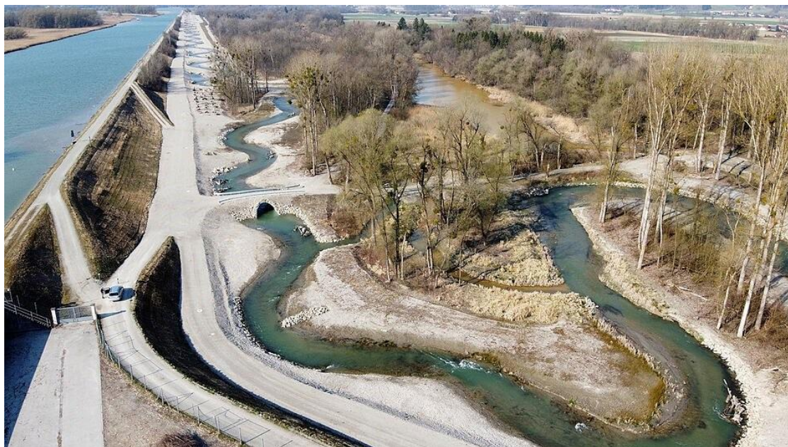
Beispiel: Luftaufnahme vom Umgebungsgewässer / Fischaufstiegshilfe in Ering-Frauenstein

Die Erfahrungswerte heute zeigen, dass ein begleitendes touristisches Besucherlenkungskonzept zur Fischaufstiegshilfe Ering am Inn – Frauenstein aufgrund der starken Besucheranziehung sinnvoll gewesen wäre.