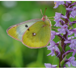
Der Hochmoorgelbling ist ein typischer Bewohner der Moore.

Für Sie als Grundeigentümer oder Bewirtschafter ist wichtig zu wissen, dass einige Biotope gesetzlich geschützt sind. Geschützte Biotope dürfen nicht zerstört oder erheblich beeinträchtigt werden.