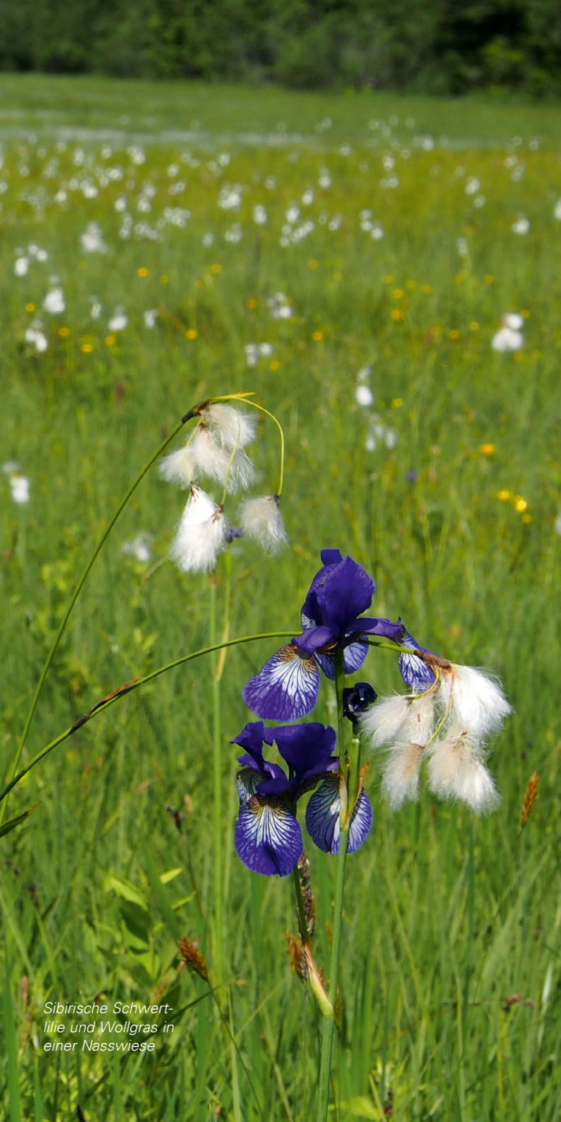
Sibirische Schwert- lilie und Wollgras in einer Nasswiese