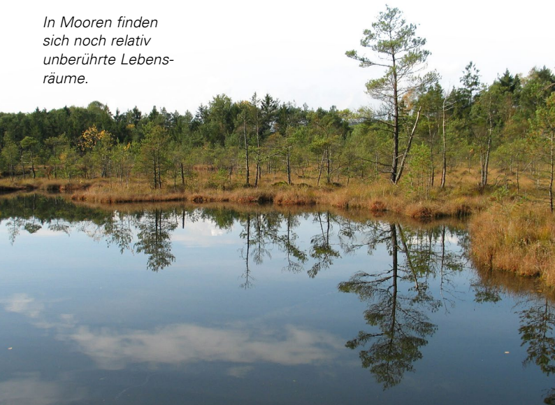
In Mooren finden sich noch relativ unberührte Lebensräume.

Daher ist es wichtig, sich über eventuell vorhandene Biotope auf dem eigenen Grund oder auf den von Ihnen bewirtschafteten Flächen zu informieren. Hierzu können Sie den UmweltAtlas Bayern nutzen, siehe Seite 7.